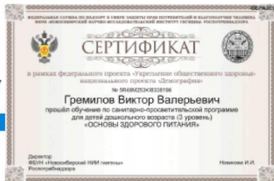
Рис. 15. – Просмотр результатов итогового тестирования и получение сертификата, подтверждающего успешность прохождения обучения

В случае если набрано менее 80% правильных ответов, Программа указывает проблемные разделы и предлагает пройти тестирование повторно. Количество повторных тестирований не ограничено по количеству, но ограничено по времени. Повторное тестирование можно пройти не ранее чем через 24 часа от предыдущего тестирования.